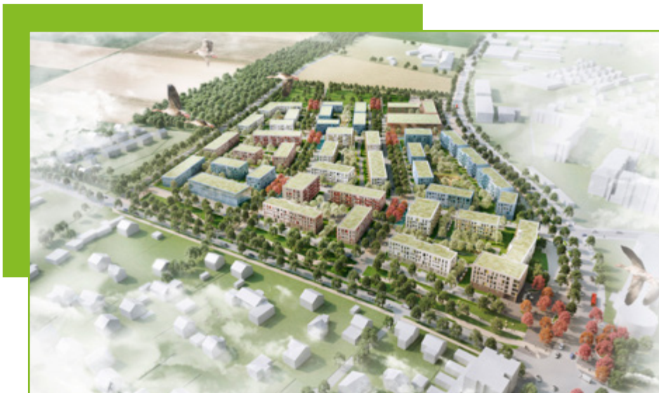
Visualisierung: © reicher haase assoziierte