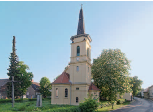
Der Bohnsdorfer Dorfkirche

Freiwillige Feuerwehr, Kino im A10-Center